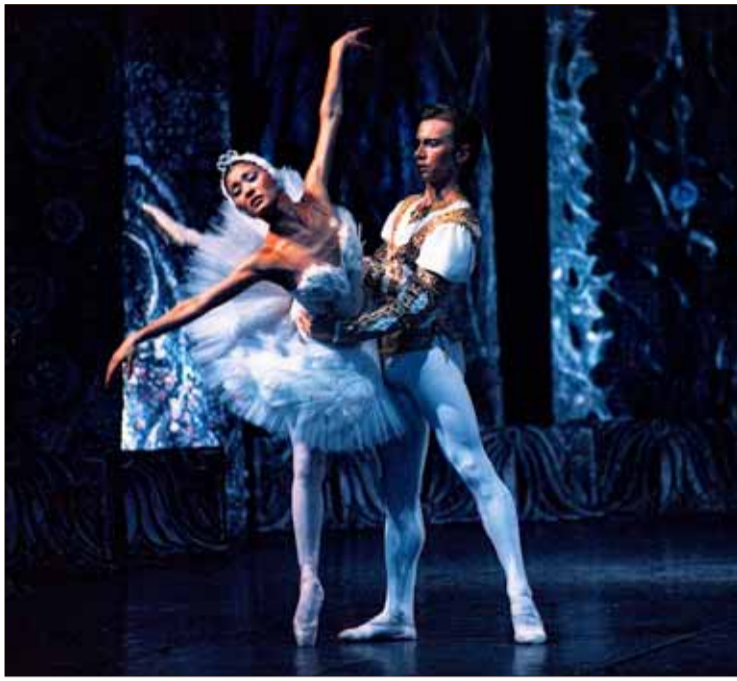
Dos bailarines durante la representación de 'El lago de los cisnes'.